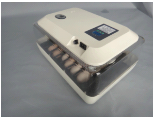
Рис. 5: Верхняя крышка ставится на нижнюю часть инкубатора. Обратите внимание, что обе части должны ровно стоять друг на друге и плотно прилегать друг к другу. Инкубатор готов к работе и может быть включён в сеть питания.