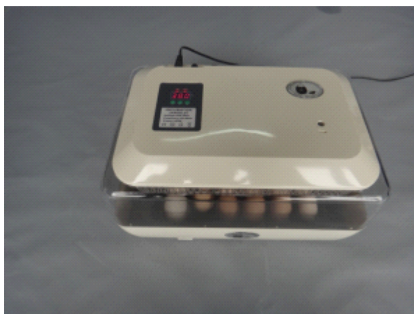
Рис. 6: Если инкубатор не работает (т.е.: не вращается вентилятор, не показывает температуру), то проверьте состояние предохранителя на задней части крышки инкубатора и, в случае необходимости, замените его. Предохранитель может выйти из строя, если инкубатор деформирован или в него попала влага. После включения инкубатора на индикаторе может отображаться знак "L". Для перехода в режим отображения текущей температуры нажмите любую из трёх кнопок на панели управления. Пожалуйста, не изменяйте настройки инкубатора, если вы не уверены, как это делать и для чего это нужно. Заводские настройки температуры позволяют обеспечить высокую выводимость даже без их корректировки. В период вывода вентиляционное отверстие на верхней крышки инкубатора (справа) должно быть открыто полностью.