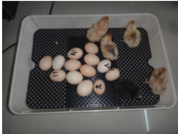
Рис. 7: За три дня до окончания инкубации (т. е. на 18 день для кур) выньте подвижной лоток из инкубатора и распределите яйцо по всей плоскости сетчатой пластины. Если на яйцах имеется проклёв, то эти яйца нужно расположить проклёвом вверх. Не извлекайте птенцов и скорлупу до окончания вывода, т.е. до полного высыхания (распушения) птенцов, это может привести к потере влажности. По завершении инкубации, птенцы могут быть перемещены для последующего кормления или вакцинации.