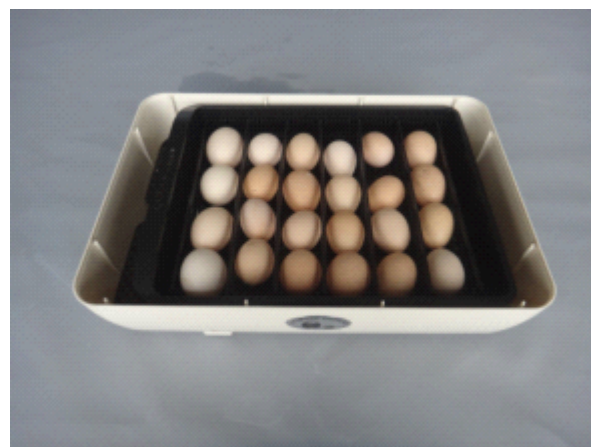
Рис. 3: Положите подвижной лоток для яиц на сетчатую пластину и поставьте перегородки в зависимости от размера яйца для инкубации, ширина каждого отделения должна быть на 5-10мм больше диаметра яйца, чтобы обеспечить хороший-безприпятственный поворот яиц.

Рис. 2: Положите сетчатую пластину гладкой поверхностью вверх, для обеспечения лучшего скольжения-поворота яйца.